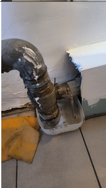
Zawory na odejściach wody bytowej oraz hydrantowej do wymiany, zawór wody bytowej do wymiany łącznie z odcinkiem od zaworu do rurociągu PPR