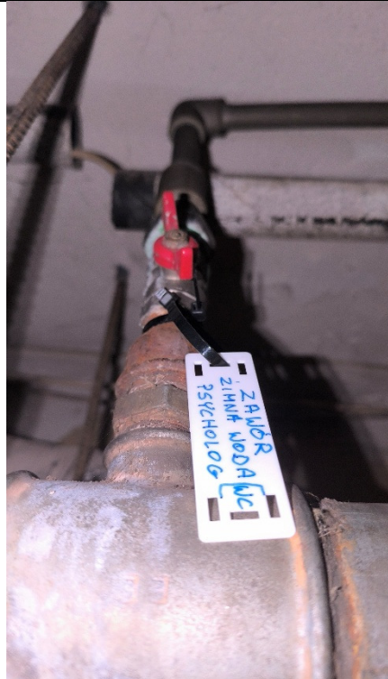
Zawory na odejściu do łazienek