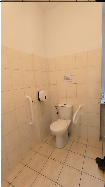
Umywalka i miska ustępowa do podłączenia.