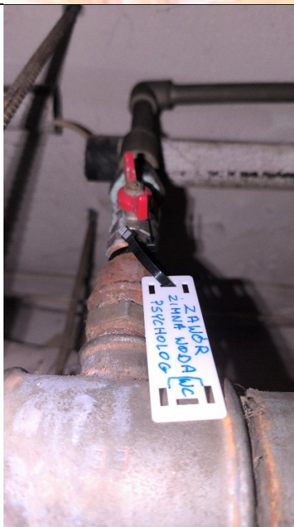
Zawory na odejściu do łazienek w suficie podwieszanym przeznaczone do wymiany