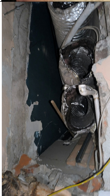
Rurociągi przeznaczone do wpięcia znajdują się w suficie podwieszanym toalety, nad kanałami instalacji wentylacyjnej